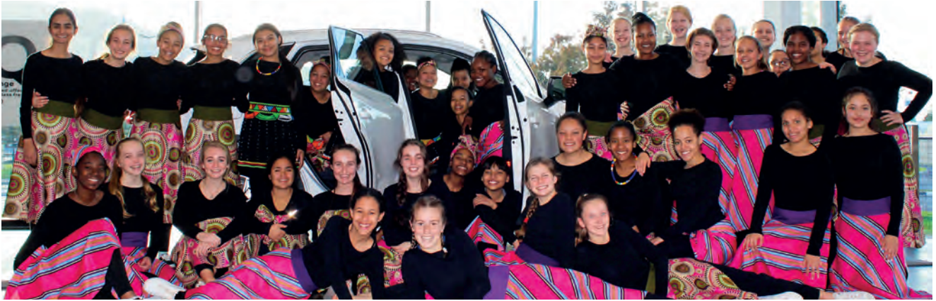
KOOR – Audi Sentrum.