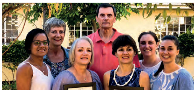
Uitmuntende Akademiese Prestasie in Wiskunde en Huistaal.