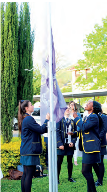
HOSTEL – Flag seremony new prefects.