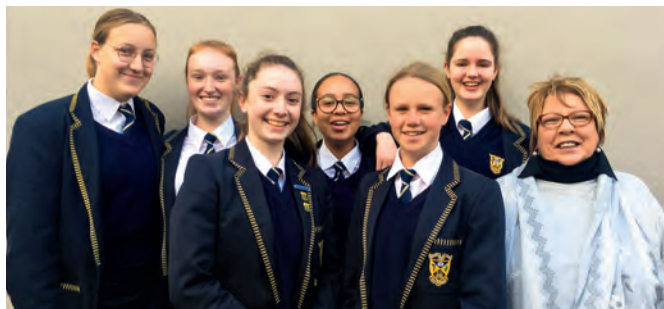
Academic Achievers Tour.