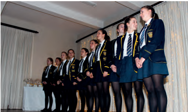
HOSTEL – Inauguration of Prefects.